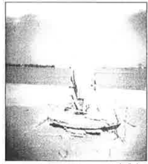
رأعمال زياد عنتر