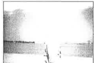
رأعمال زياد عنتر

ويعدوه، فنحن سؤزان هيلبرسمت الأوتار عبر مجموعة تسجيلات لثلاث عشرة سنة في مدينة الفيلسوف في سياق الفيلم الصامت الأخير، يربط بين أرفاغوا وأجملها، أما أمريكا مايلتشي، فنحن صور مهاجرين لا يمكن أرفاغوا، أما إجابة لشارة الألفية، على خلفية هذا الصور، تظهر لوحة ما Grand Galerie للفنان هوبير زوبير في الورق، إنما عممة من الآثار.