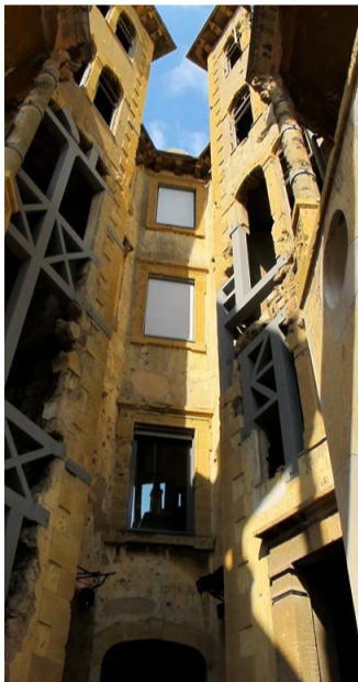
Beit Beyrouth, la Maison jaune.