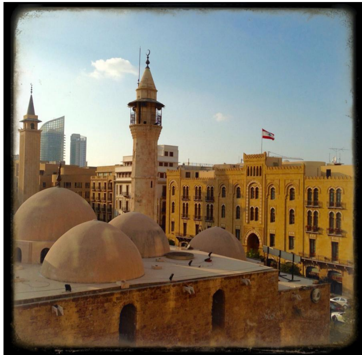
Au nord de la place des Martyrs, la mosquée du Séraïl ou mosquée Assaf, face à la municipalité de Beyrouth, dont on devine le sky line.