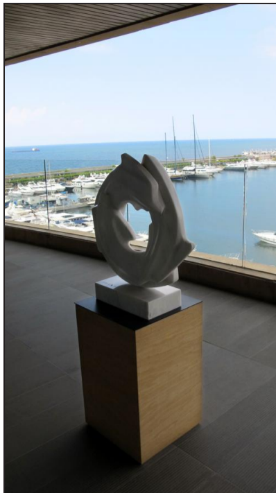
Dans la marina de Beyrouth, à Dbayeh, on visite sur rdv des collections d'art exceptionnelles.

1 euro équivaut à, environ, 1600 livres libanaises. ■