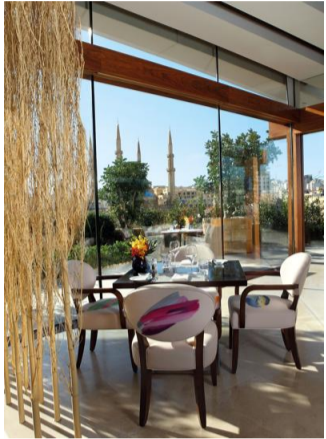
Restaurant Indigo, de Le Gray.

DU COIN de l'œil, la place des Martyrs, l'horizon azurée de la Corniche, les enseignes chic, le cœur palpitant du centre historique de Beyrouth : ainsi entouré l'hôtel Le Gray se distingue. L'établissement décline jusqu'à la piscine sur le toit un luxe feutré. Il y a bel et bien un esprit Le Gray dont les cinq étoiles scintillent à travers les nombreuses œuvres d'art qui accompagnent le regard. Dans les